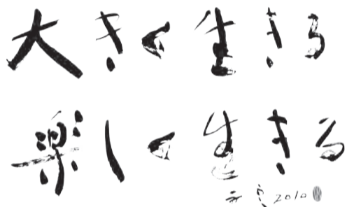
書・本学教授 広瀬 舟雲